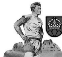
Mittelländisches Schwingfest Riggisberg | 15.-17. Mai 2020

Die Vorbereitungen für das Mittelländische Schwingfest vom 15. – 17. Mai 2020 in Riggisberg schreiten termingerecht voran. Der Vorverkauf für Eintrittskarten wird rege benutzt. Für Festbesucher werden zusätzliche Postautokurse geführt. Das Rahmenprogramm steht fest und auf die Schwinger warten mehrere Lebendpreise.