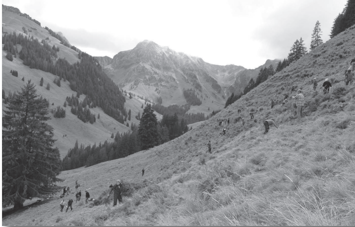
Über 15 Einsätze mit grösseren und kleineren Gruppen organisiert die Geschäftsstelle des Naturparks Gantrisch jedes Jahr.

Eine nachhaltige Produktion ist arbeitsaufwändig, nicht nur im Sommerungsgebiet. Damit sich auch in der heutigen Zeit eine extensive Bewirtschaftung auf kleinen Flächen und mit kleinen Betrieben lohnen kann, braucht es Unterstützung. Diese bietet der Naturpark, indem er die Bauern berät, bei der Pflege von Hecken, Feldobstbäumen, Ufergehölz etc., aber auch beim Vertrieb und bei der Vermarktung von regionalen Produkten unterstützt.