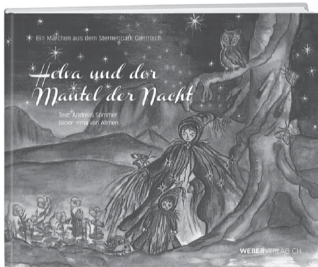
Das neue Kinderbuch „Helva und der Mantel der Nacht“

Unter dem Mantel der Nacht verschwindet vieles. Was am Tag hell und klar ist, sieht man nach Einbruch der Dämmerung nicht mehr. Nur noch die wichtigsten Konturen sind im Sternenlicht erkennbar. Die Nachtlandschaft ist sehr sanft. Mit künstlichem Licht jedoch setzen wir Menschen grelle Akzente. Wir beleuchten Wege und Strassen, Gärten und Denkmale und betreiben mit leuchtenden Reklamen sogar noch nach Mitternacht Werbung für Einkaufsläden, Gaststätten und vieles mehr. Die meisten Menschen verschlafen dies jedoch. Es stellt sich die Frage nach dem Nutzen von all diesem künstlichen Licht. Mit dem Projekt «Nachtlandschaft» hat sich der Naturpark Gantrisch der Dunkelheit verschrieben und möchte Verständnis für die Wichtigkeit der Dunkelheit und den natürlichen Rhythmus von Tag und Nacht wecken. Ziel ist es, den Nutzen der Lichtquellen in der Nacht zu reflektieren und die unnötige Verschwendung von Kraft und Energie zu reduzieren.